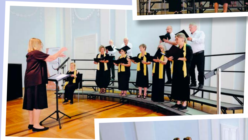
Zamirchor Bayreuth Kammerchor