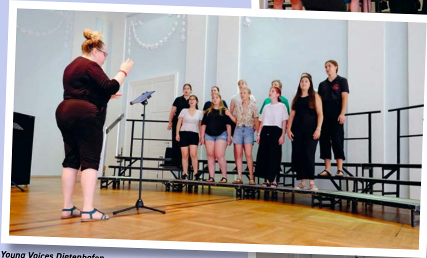
Young Voices Diethenhofen