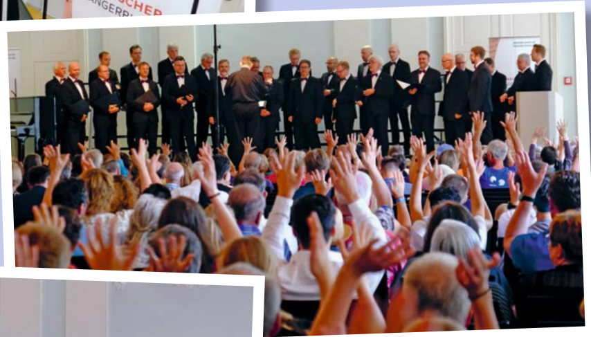
Männerchor GV Thüngerheim