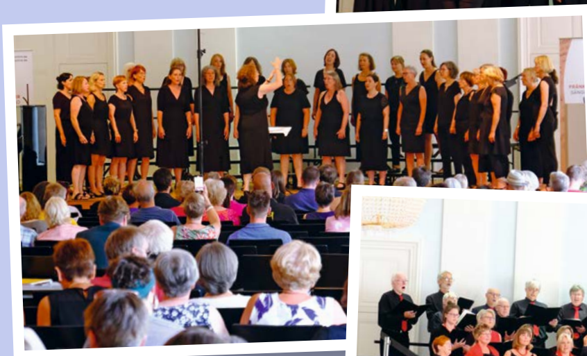
Frauenchor GV Thüngersheim