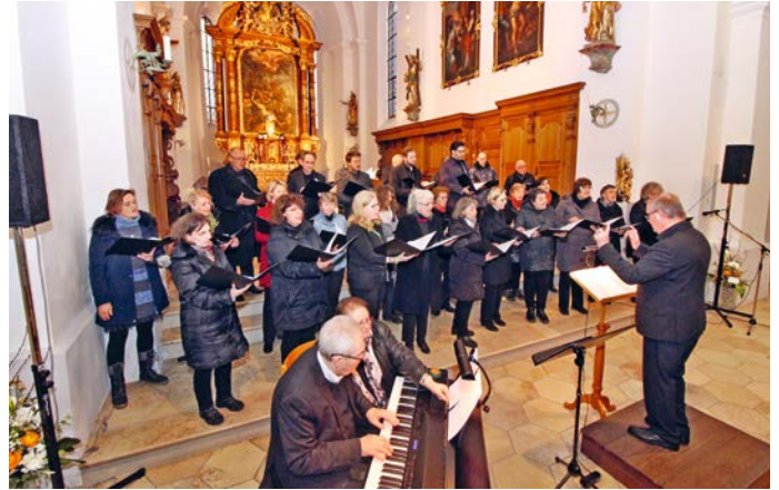
Das Weißenburger Ensemble „Musica Sacra“ und das Spalter Vokalensemble „Voicepack“ glänzten beim Spalter Kultursommer.