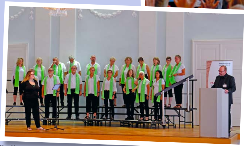
New Voices Ammerndorf