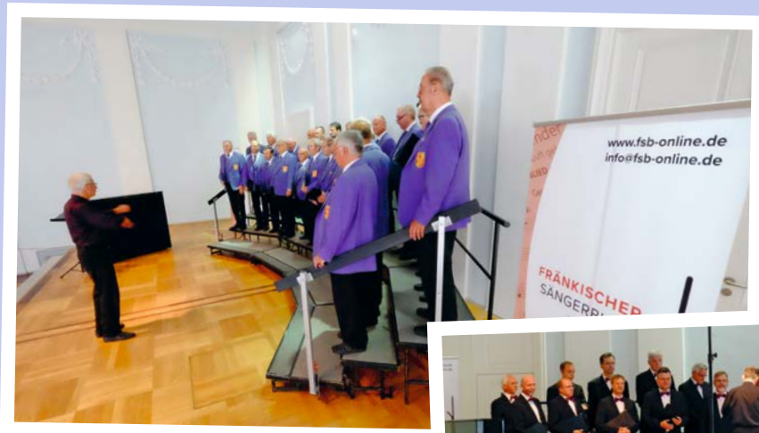
MGV Cäcilia Ornbau