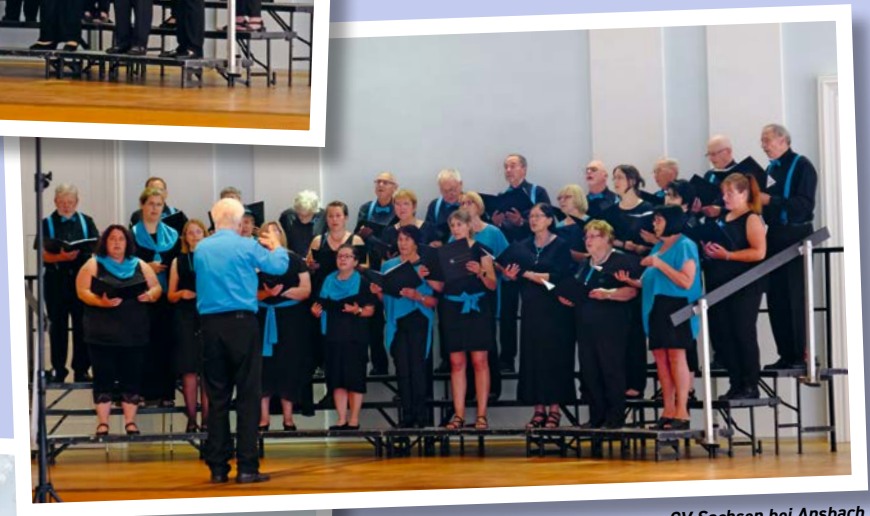
GV Sachsen bei Ansbach