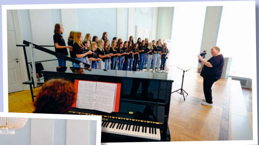
Cantemus GuM Feuchtwangen