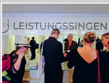
Titelbild: Herzlich Willkommen zum Leistungssingen in Ansbach!

BEILAGENHINWEIS - IMPRESSIONEN VOM LEISTUNGSSINGEN